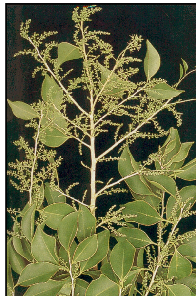
a. Rama con flores