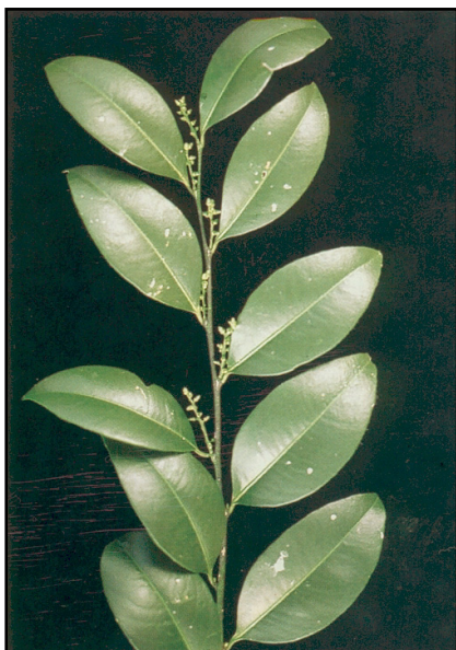
a. Rama con flores